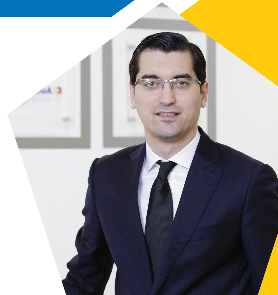
Răzvan Burleanu Președintele Federației Române de Fotbal

Vă doresc inspirație și putere de muncă!